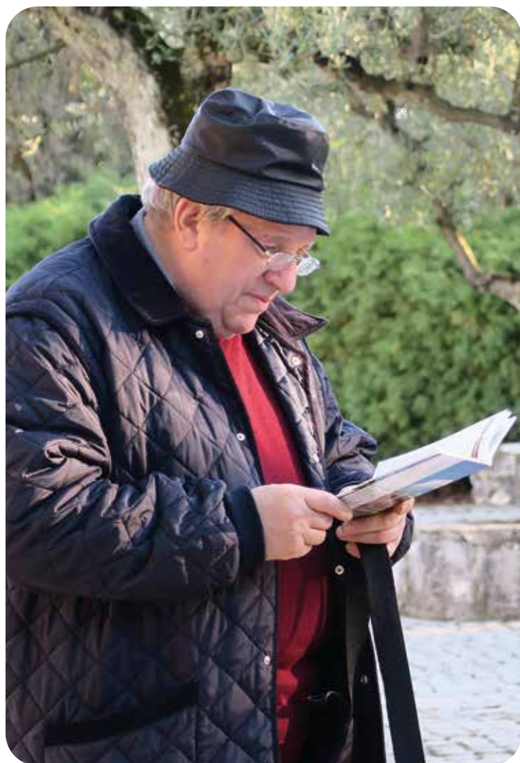
Durante un pellegrinaggio a Fatima

Ha vissuto in mezzo a noi dedicando tempo, energie, in più circostanze. Quando entravi in chiesa, ti sembrava di avere a che fare con una persona di famiglia. Un saluto, un gesto di accoglienza, una battuta, ti rendeva più familiare, più bello anche l'incontro con il Signore. Entrando in chiesa ti sentivi sempre accolto, avevi l'impressione di far parte di una comunità. Con il suo modo di fare, di parlare, di dialogare ti faceva sentire quasi a casa tua, in famiglia. Hanno sempre suscitato ammirazione la sua preoccupazione di avere a cuore la chiesa in tutti i suoi aspetti. Il suo sguardo, anche di sfuggita, era sempre attento per vedere se tutto era in ordine, se tutto era pulito, aveva un'attenzione anche per i più piccoli particolari. Aveva una particolare cura per i paramenti e gli abiti liturgici, che lungo il corso del tempo avevano resa bella e preziosa la chiesa di Albate. Gli affreschi, i quadri, le decorazioni, le diverse immagini di santi erano al centro della