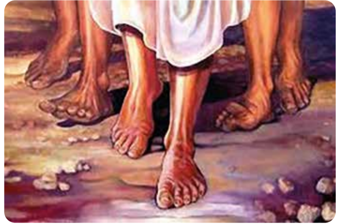
"Mentre erano in viaggio per salire a Gerusalemme, Gesù camminava davanti a loro..." (Mc 10,32)