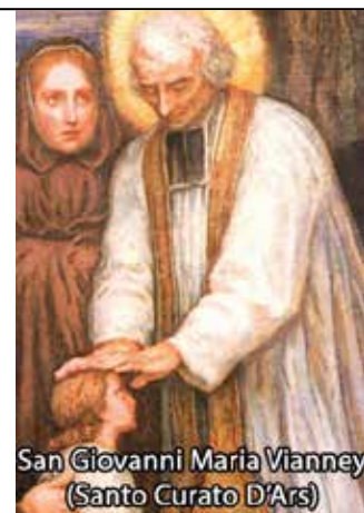
San Giovanni Maria Vianney (Santo Curato D'Ars)